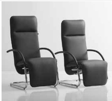
Fino und Fino XL