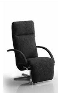
Sessel mit Sternfuss hier: Flachstahlarmlehnen